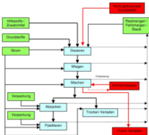
Graphik 1: Herstellungsprozess (grün: Input; rot: Input der verschiedenen Sorten; blau: Einheitsprozess)

Die Rohstoffe – Sand, Bindemittel, Hilfsstoffe, Zusatzmittel und -stoffe (siehe Grundstoffe) – werden im Herstellwerk in Silos gelagert. Aus den Silos werden die Rohstoffe entsprechend der jeweiligen Rezeptur gravimetrisch dosiert und intensiv miteinander vermischt. Anschließend wird das Mischgut abgepackt und entweder als Werk-Trockenmörtel trocken in Gebinden oder Silos oder als Werk-Frischmörtel fertig gemischt mit Wasser ausgeliefert.